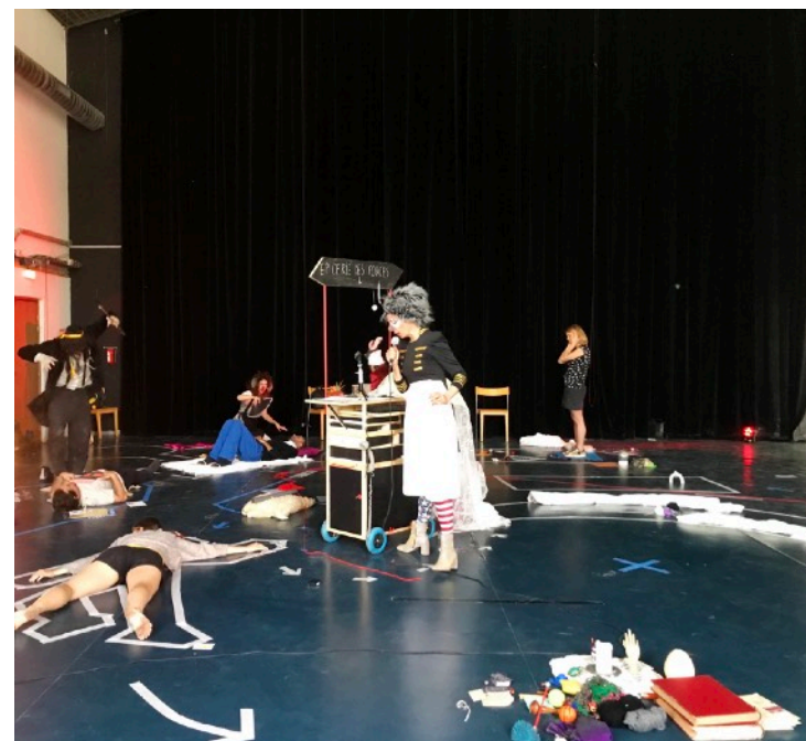
Dispensaire Doctolibre à Lieux Publics, mai 2023

En recherche de partenariats/résidences de création