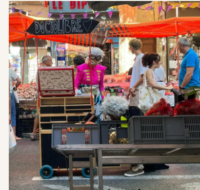
poste de soin

Mobilité : le poste peut changer d'emplacement en cours de jeu ou non