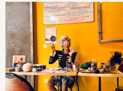
à la table